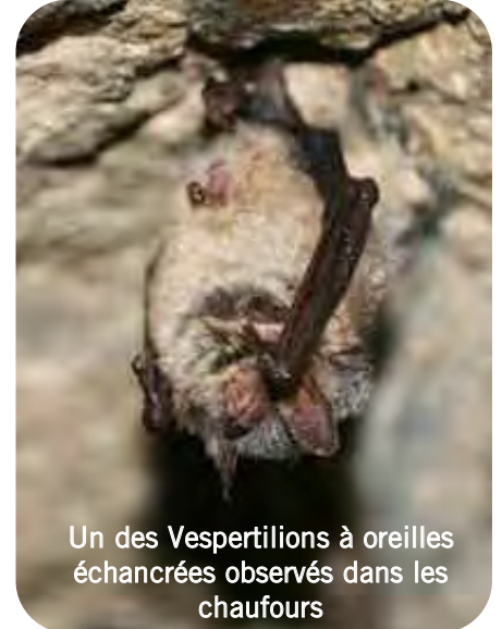
Un des Vespertillons à oreilles échancrées observés dans les chauffours

cm, très rarement des cavités plus importantes, même profondes. Le plafond des voûtes est très prisé et la hauteur occupée sur les parois verticales est majoritairement située à un minimum d'1m50. Les rares individus suspendus occupent le plus souvent des salles où l'hygrométrie est importante, mais la hauteur des plafonds ne semble pas déterminante; ainsi certains Vespertillons de Daubenton ( Myotis daubentoni ) ou à oreilles échancrées ( Myotis emarginatus ) ont été observés accrochés à un plafond très bas (hauteur d'environ 1 m) parfois sans eau libre dessous, ce qui n'est pas très sécurisant pour ces individus.