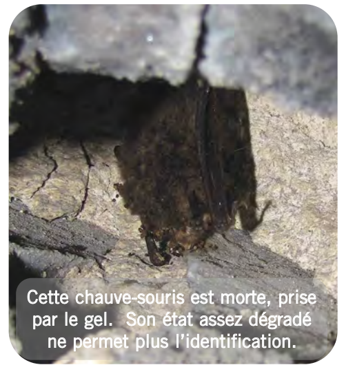
Cette chauve-souris est morte, prise par le gel. Son état assez dégradé ne permet plus l'identification.