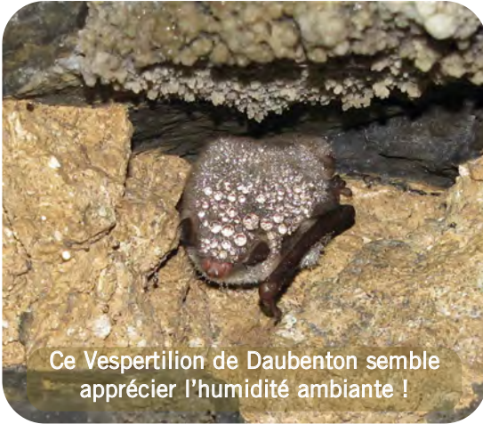
Ce Vespertilion de Daubenton semble apprécier l'humidité ambiante !

Comme il s'agit le plus souvent de galeries reliant des chaudières, le courant d'air est le facteur le plus limitant pour l'accueil des chiroptères, surtout s'il est associé à de basses températures et à des infiltrations d'eau dans les murs givrant leurs parois. Ce problème récurrent s'explique par la recolonisation végétale et le manque de protection du toit des bâtiments. La percolation de l'eau est classiquement le facteur principal de dégradation des chauffours.